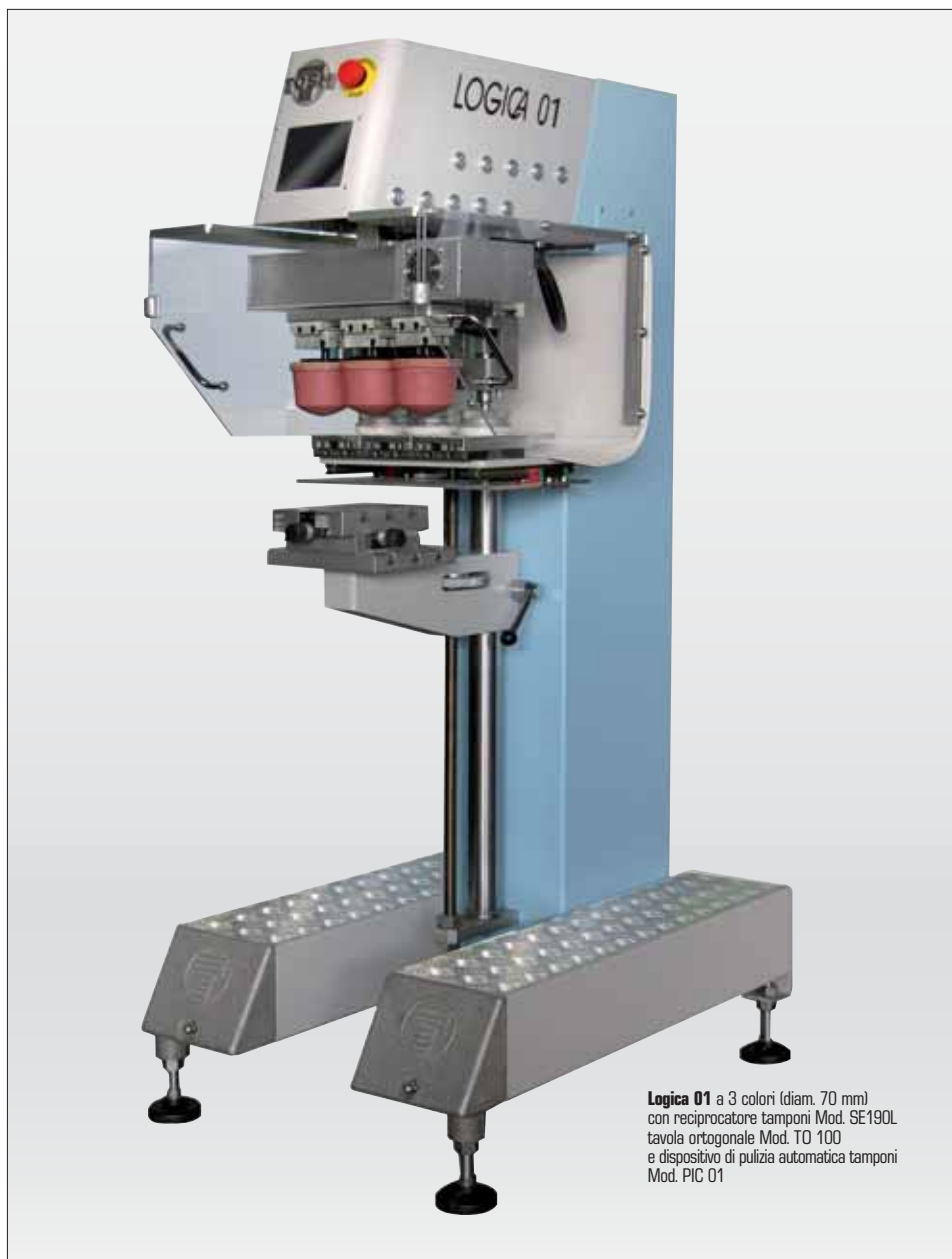
Logica 01 a 3 colori (diam. 70 mm) con reciprocatore tamponi Mod. SE190L tavola ortogonale Mod. TO 100 e dispositivo di pulizia automatica tamponi Mod. PIC 01