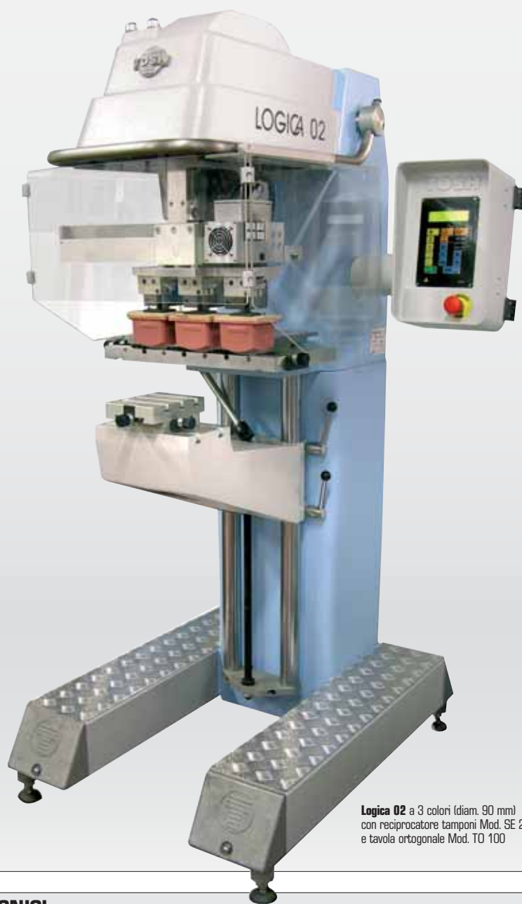
Logica 02 a 3 colori (diam. 90 mm) con reciprocatore tamponi Mod. SE 228 e tavola ortogonale Mod. TO 100