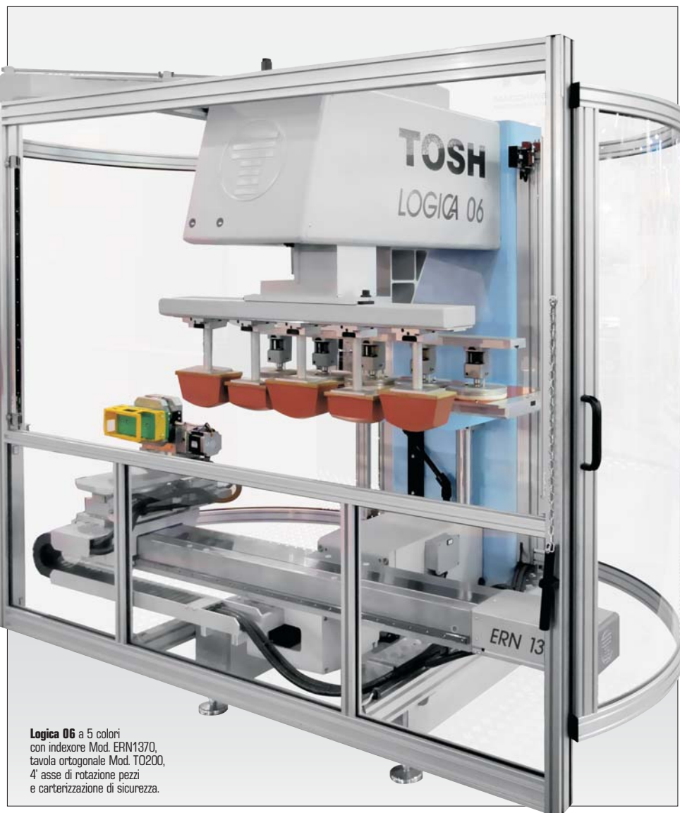
Logica 06 a 5 colori con indicore Mod. ERN1370, tavola ortogonale Mod. T0200, 4' asse di rotazione pezzi e carterizzazione di sicurezza.